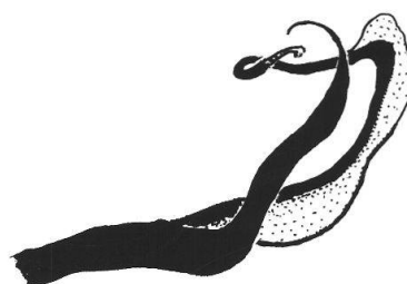
Figure 2: Apiloscatopse handlirschi (Duda), pénis du mâle.

A. handlirschi est une espèce très mal connue qui n'a jamais été signalée depuis sa description par DUDA (1928). Elle a été redécrite par COOK (1974) qui a étudié une partie de la série-type. J'ai pu examiner une longue série de spécimens capturés en Italie (province du Trentin: Dolomites) par Miroslav Barták et provenant des localités suivantes: Passo Rolle, 46°13N 11°42E, 1900 m, prairie alpine, 8.VIII.1988, 22 mâles, 2 femelles; même localité, 1700 m, forêt de mélèzes, 1 mâle ; San Martino, 46°11N 11°41E, 1300 m, forêt d'épicéas, 8.VIII.1988, 1 mâle, tous leg. M. Barták, (CMB et MHNN). L'espèce semble liée à l'étage subalpin supérieur et à l'étage alpin inférieur des Alpes, tout comme une autre espèce du genre Apiloscatopse , A. styriaca (Enderlein, 1926). Le spécimen du Pas de Cheville a d'ailleurs été capturé au filet, en fauchant les herbes, en même temps que plusieurs individus de cette dernière espèce. A. handlirschi est également présente sur les pelouses sommitales du Jura comme l'indique la capture de La Dôle. Les localités suisses mentionnées dans