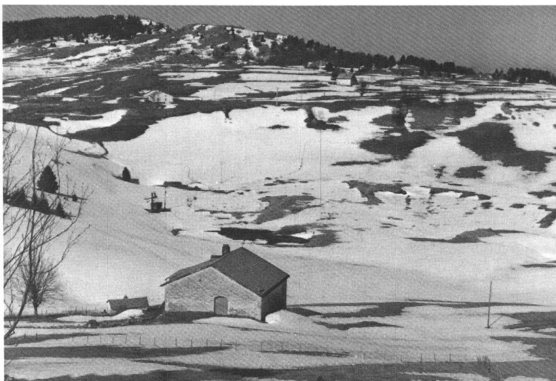
Fig. 2. Mégadoline de Sous-la-Vye, à l'W de l'Embossieux (commune de la Pesse), sur le haut plateau des Molunes, au SE de Saint-Claude. Tourbière inondée, au printemps 1984.

L'évolution active des vallées sèches en période froide doit-elle être attribuée aux dépôts qui les feutrent (DAVEAU 1965), au blocage de l'épikarst par l'englacement des réseaux (hypothèse de CIRY, rappelée par DELANCE 1988, p. 14) ou à une activation des circulations karstiques au voisinage de la zone englacée? En effet dans les cavités de la marge périglaciaire würmienne on observe systématiquement une lacune d'érosion, au cours du pléniglaciaire supérieur, entre -30\ 000 et -15\ 000 (CAMPY et RICHARD 1988).