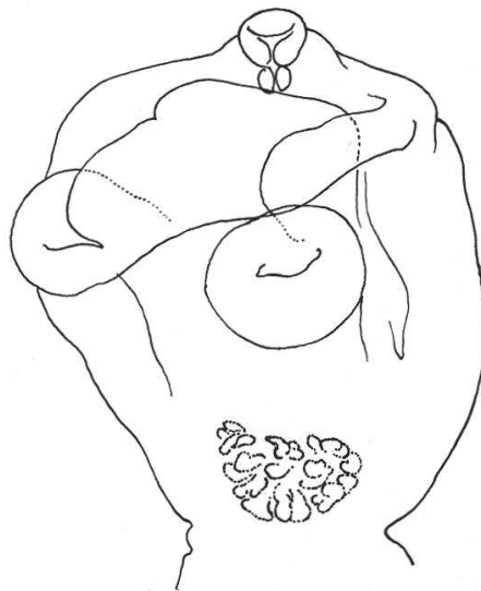
Fig. 2. Strigea hierococygis n. sp., de Cuculus (Hierococyx) varius Vahl. Segment antérieur d'un para- type montrant la grosseur de la ventouse ventrale.

Lg. du Ver 2,22-3,15 mm. SA 0,85/0,69-0,74 mm; SP 1,38-2,35/0,65-0,74 mm. Rapport des longueurs: SP/SA = 1,64-2,76. VB marginale, saillante, 92-98/104-112 \mu ; PH 46-78/52-92 \mu ; VV équatoriale, 205/220 \mu , faiblement musculeuse (difficilement visible) 1 ; rapport largeur SA/diamètre transversal VV = 3. GP multilobée, 170-195/215-225 \mu , à la base du SA. OV réniforme, situé aux 2/5 du SP. TT grossièrement lobés: TA 340/560 \mu ; TP 420/480 \mu . VG envahissant le SA jusqu'à la hauteur des PV; abondants dans la zone prétesticulaire du SP, puis réduits à un ruban ventral médian de densité faible, qui se condense en arrière des TT, en remontant latéralement, pour se terminer au-devant de la BC; RV et GM intertesticulaires. BC courtement cylindrique, 260-300/390-420 \mu , délimitée par une constriction et munie d'un anneau musculaire (« Ringnapf ») épais de 85 \mu , à atrium profond de 210-250 \mu ; diamètre du CG (mesuré dans ce dernier) 160 \mu 2 . (Pour les abréviations: cf. DUBOIS 1968b, p. 13.)