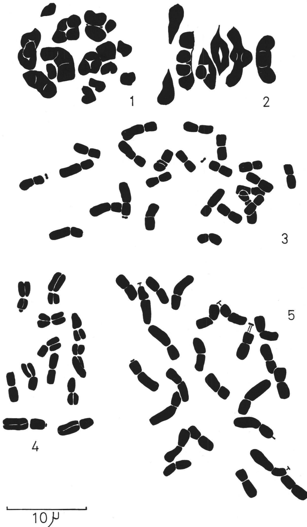
Fig. 1. Onosma vaudense , métaphase I de la microsporogénèse. La Clapière. Fig. 2. Onosma fastigiatum , métaphase I de la microsporogénèse. La Clapière. Fig. 3. Onosma fastigiatum , mitose radriculaire. Maurin. Fig. 4. Onosma fastigiatum , mitose radriculaire. Auron. Fig. 5. Onosma fastigiatum , mitose radriculaire. Lozère.