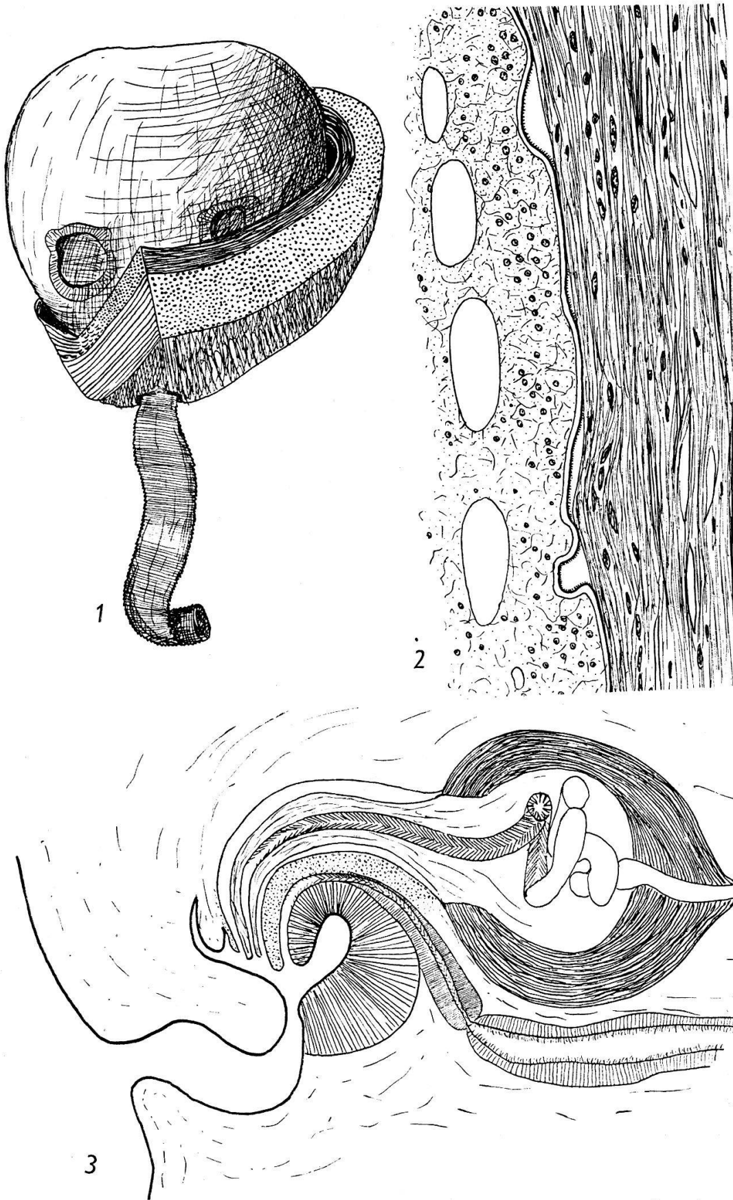
Fig. 1-3. Strobilocephalus triangularis (Diesing 1850). 1. Scolex en place dans la paroi intestinale dont une portion a été enlevée; 2. Coupe passant à travers le scolex (à gauche) dont le revêtement d'épines est visible ainsi que le réseau vasculaire périphérique; 3. Coupe passant par l'atrium montrant la musculature du vagin.