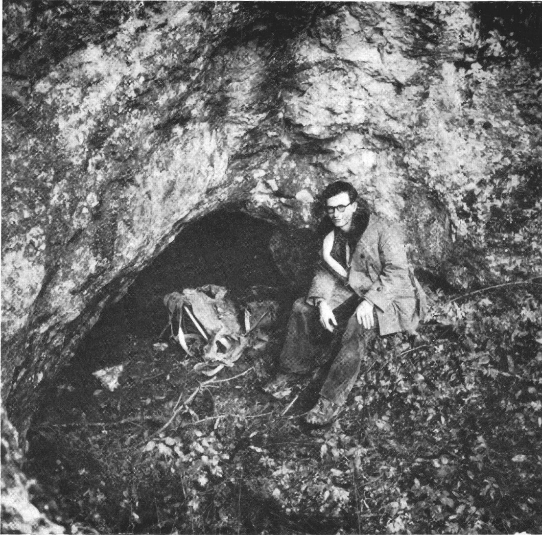
Entrée de la grotte de Pertuis.