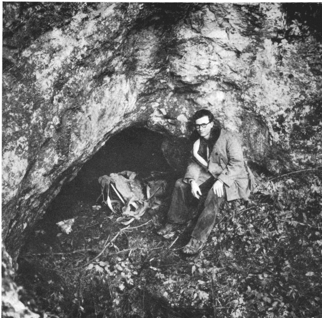
Entrée de la grotte de Pertuis.