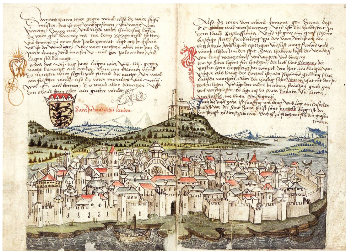
Zara nel 1487 (Conrad Grünenberg, Beschreibung der Reise von Konstanz nach Jerusalem. Bodenseegebiet, um 1487 – Badische Landesbibliothek Karlsruhe, Cod. St. Peter)

dell'arte notarile rispetto a quella «definita dall'Università di Bologna», che conosciamo invece per la nostra regione 3 .