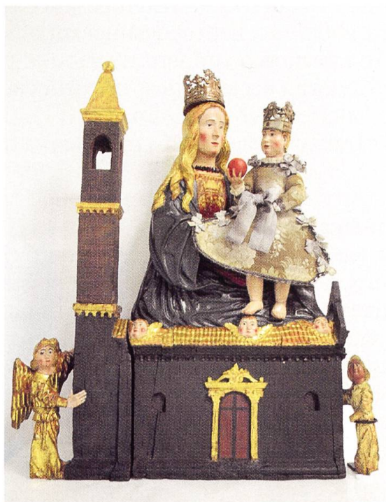
Madonna di Loreto, ca. 1510, legno scolpito, dorato, dipinto e graffito (Bellinzona, chiesa di S. Rocco, Scuola di S. Rocco)

Dagli atti traspare che alcuni pezzi del vasellame argenteo risultavano irreperibili, pertanto previa infruttuosa indagine presso il commissario governativo incaricato di alienare tali articoli, fu fatta segnalazione alla procura pubblica, i cui esiti non sono noti.