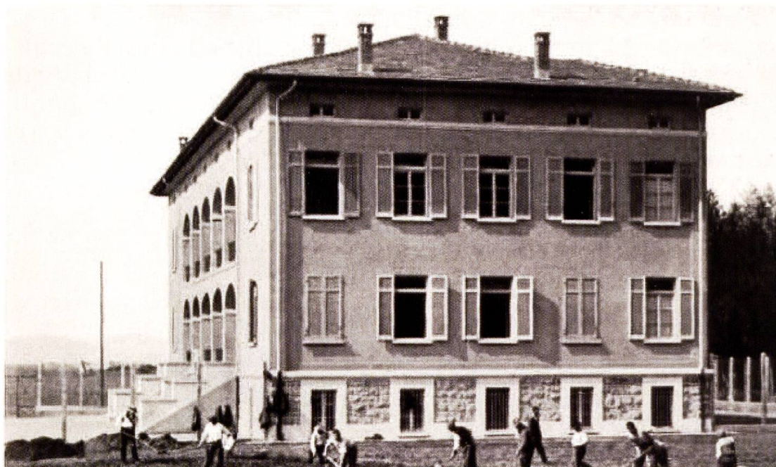
Internati amministrativi al lavoro nei campi circostanti La Valletta, 1934