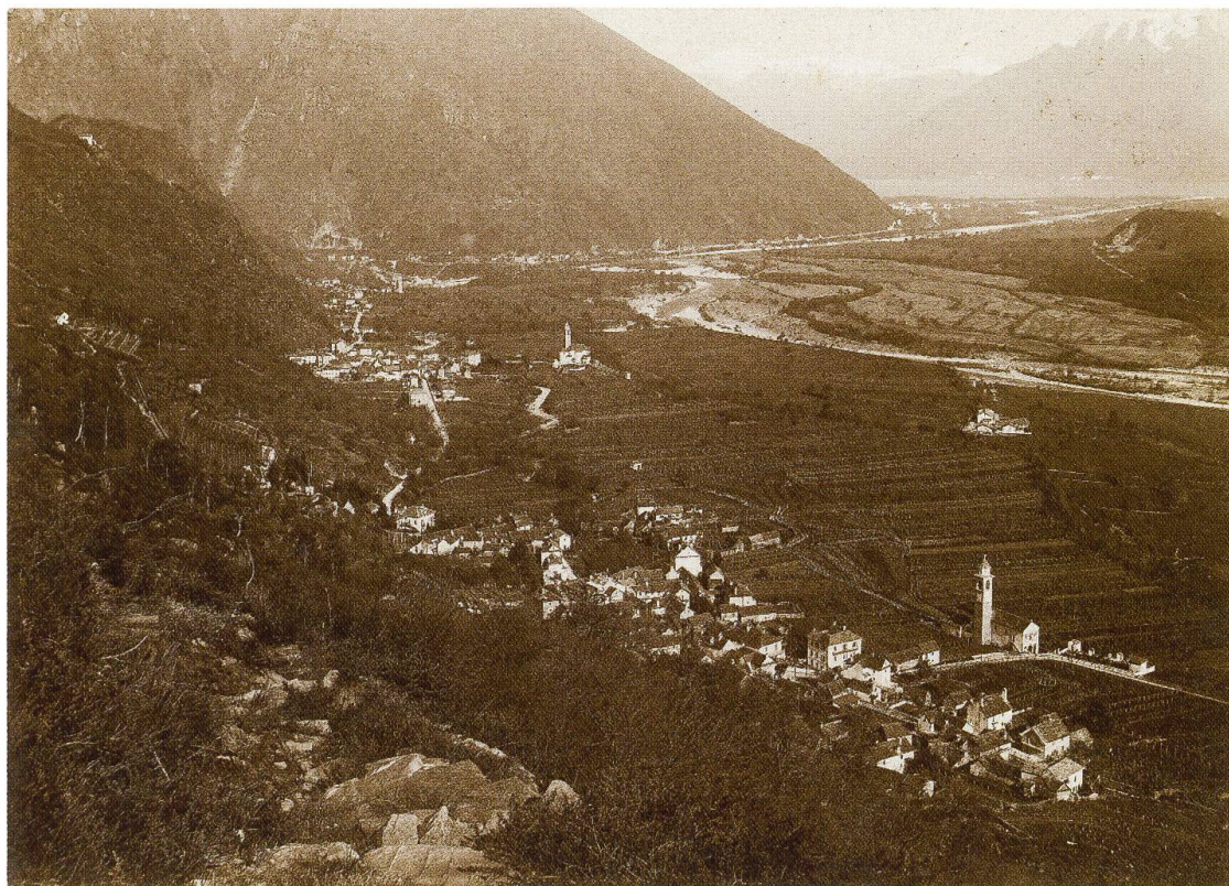
Figura 1: i comuni Cavigliano, Verscio e Tegna ritratti da Valentino Monotti (1915 circa). ASTi, Monotti S/39.9.

Inizia così una vicenda giudiziaria durata oltre quattro anni, che ha probabilmente marcato gli animi degli abitanti delle terre di Pedemonte. Partendo da documenti rinvenuti nel fondo della famiglia Peri di Cavigliano (XIX-XX sec.) e nel fondo Processi civili e penali, entrambi conservati e consultabili presso l'Archivio di Stato, è stato possibile ricostruire le tappe principali dell'indagine condotta dalla Commissione pro-