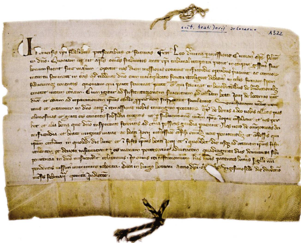
Esortazione del vescovo di Como, 12 febbraio 1322

La più antica, dedicata a San Giorgio, è documentata la prima volta nel 1298 in un atto di permuta. Nel 1322, il vescovo di Como Leone Lambertenghi esorta i Borghesi a sovvenire con i loro beni ai bisogni degli inservienti della chiesa di San Giorgio e al restauro dell'edificio sacro. La chiesa e l'annesso cimitero sono stati riconsacrati il 4 novembre 1353 17 . Gli amministratori (canepari) della chiesa di San Giorgio sono menzionati regolarmente, insieme a quelli delle altre due chiese, fino al 1481 poi di questa chiesa si perdono le tracce 18 .