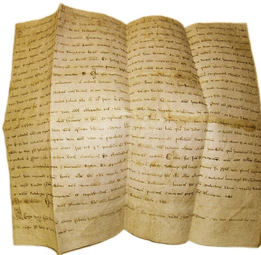
Investitura ereditaria di terreni a Piandesso e Fontanedo, 27 dicembre 1224. È il primo documento originale in cui si menziona la Corporazione dei borghesi.

Nel Duecento e nel Trecento l'attività patrimoniale prediletta dalla corporazione consisteva nell'affitto di terreni e nella concessione di enfiteusi (contratti mediante i quali il proprietario concedeva il godimento di un fondo ad altra persona, con l'obbligo di migliorarlo e di pagare un canone annuo) su terreni situati sul Piano di Magadino, nelle zone di Piandesso e Fontanedo e a Ponte Brolla.