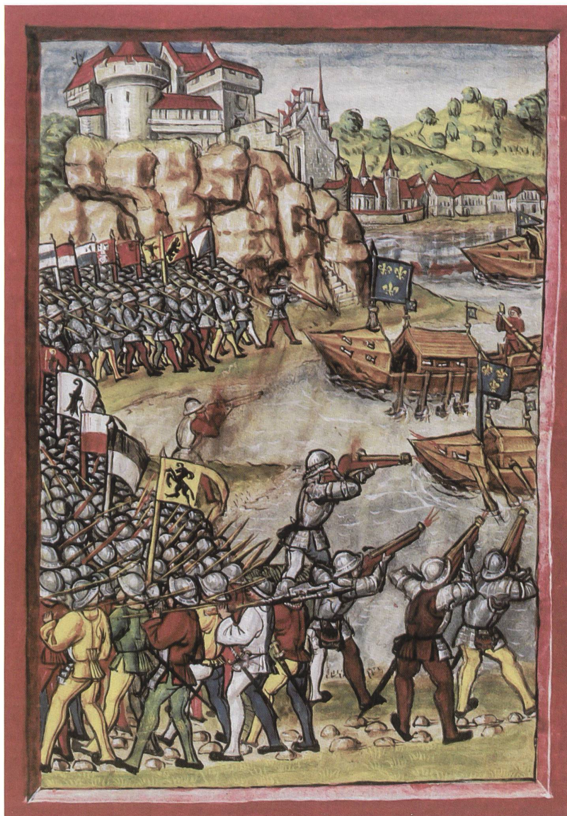
D. SCHILLING, Battaglia fra Confederati e Francesi davanti a Locarno, 1503 . Tempera su pergamena dalla Luzerner Bilderchronik 1513, foglio 214 (Cat. 1.1.1.).