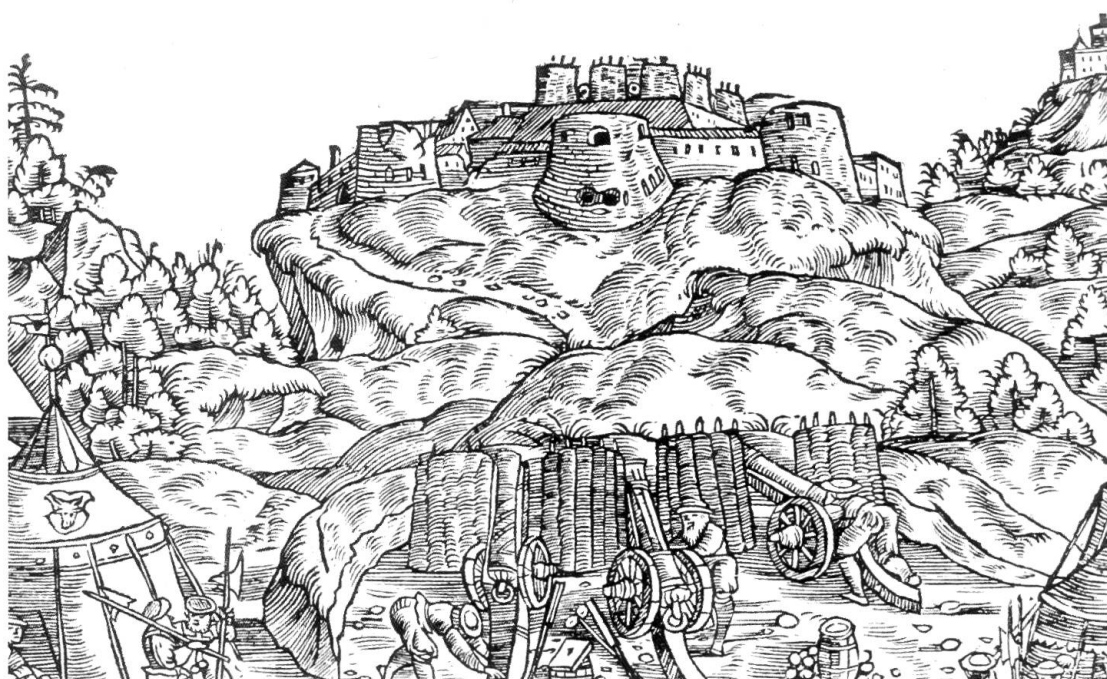
H. ASPER, Luggaris 1501, in J. STUMPF, Gemeiner loblicher Eydnosschaft Stetten Landen und Völkeren Chronich... , Zürich 1548, p. 283.