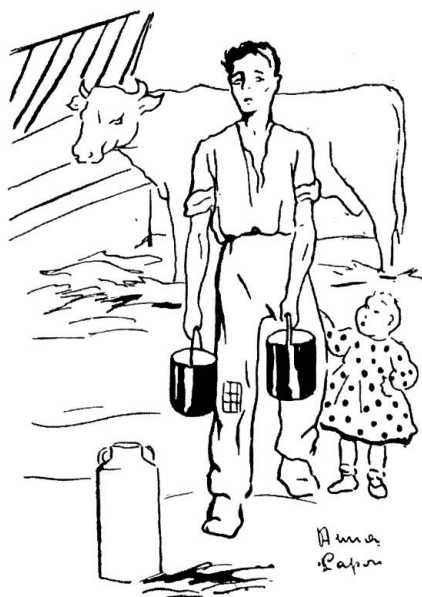
Mai dargli del latte impuro che ha subito tanti travasi e manipolazioni.