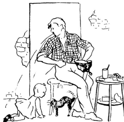
Mai sputare per terra.