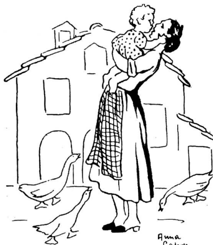
Mai baciare un bimbo sulla bocca.