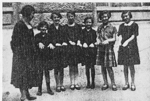
La visita alle mani, niente bordo di tutto.