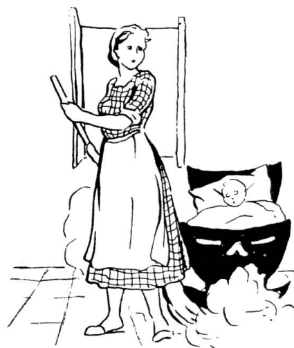
Mai sollevare polvere, scopando a secco, ma avvolgere la granata in un cencio umido.

«La rivista dei fanciulli», 1927, p. 262.