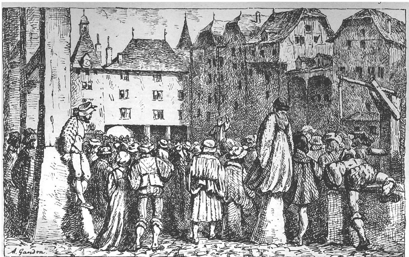
Fig. 1 Le prêche de Froment au Molard le 1er janvier 1533. Gravure d'Adolphe GANDON, dans Antoine Froment, Les Actes et Gestes , éd. par Gustave Revilliod, Genève, Fick, 1854, p. 22.

tous les épisodes, multiples dans les Actes et gestes , où intervient son prédécesseur comme personnage et qui ne sont pas absolument nécessaires à l'avancement du récit. Ainsi, le nom d'Antoine Froment n'apparaît qu'en deux endroits des Chroniques lors d'épisodes qui sont fondamentaux pour l'identité évangélique genevoise, opposée à la foi romaine. Le plus important et également le plus célèbre est sans conteste le premier prêche public prononcé à Genève, le 1er janvier 1533 sur la place du Molard par Antoine Froment. Celui-ci est arrivé en ville à la fin de l'automne 1532 et, sous couvert de donner des cours de lecture et d'écriture, il diffuse le message évangélique - avec un certain succès, si bien que, comme le raconte Roset: