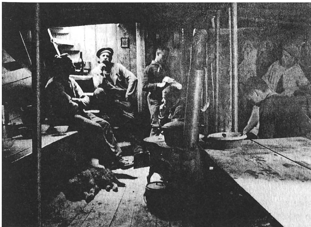
Fig. 2) : bacounis marinant dans la cambuse, d'après l'opus cité de A. Guex.

Or à cette date démarre la période où les pierres de Meillerie vont prendre la première place des marchandises recensées au port de Genève. En 1860 y sont « enregistrées 420 barques de pierres, soit 50 000 tonnes, 380 de bois, soit 57 000 stères, 272 barquées de planches, 183 de chaux et gypse, 113 de molasse, 110 de bois de construction » 25 .