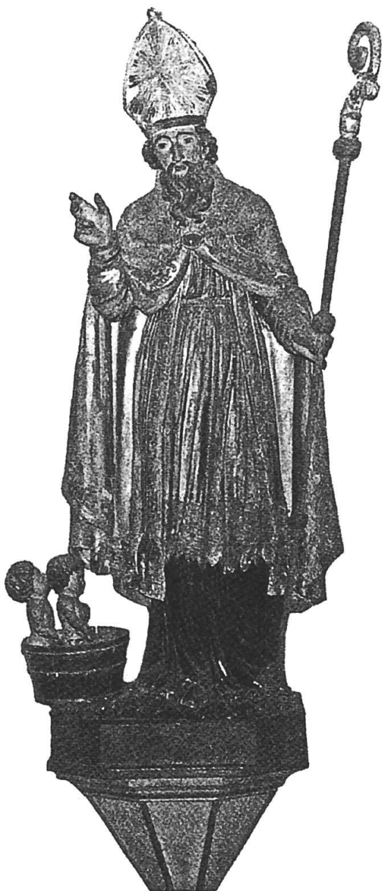
Fig. 4) Statue de saint Nicolas (XVIII e s.) portée lors des processions corporatives de Seyssel - Ain, dont P. Dufournet (op. cit. p. 28 et ill. 12 reproduite ici) signalait déjà le vol d'un des trois enfants du saloir.

ce bac ligneux, sorte de seille oblongue, aux douves doublement cerclées, autrement dit un vrai bacan franco-provençal.