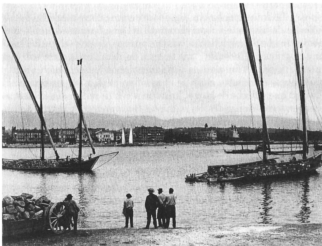
Fig. 1) bacounis marinant sur la grève, d'après l'opus cité de A. Guex.