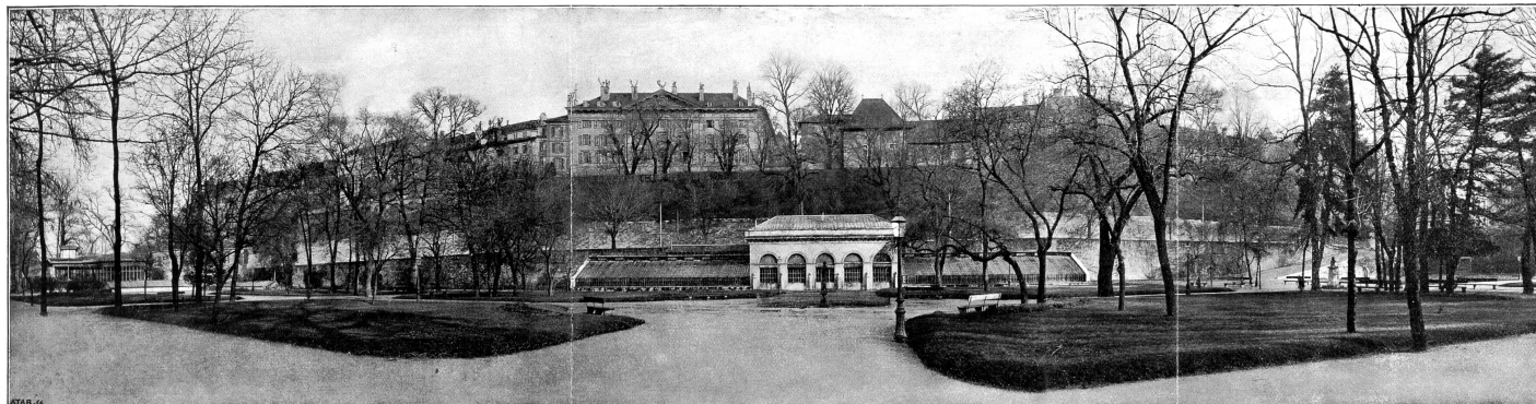
Vue et plan de la partie de l'enceinte du XVI e siècle conservée dans la Promenade des Bastions.