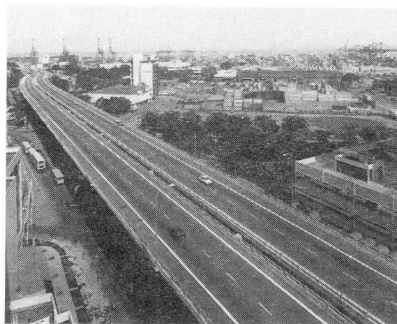
Fig. 2 Vue générale de l'ouvrage