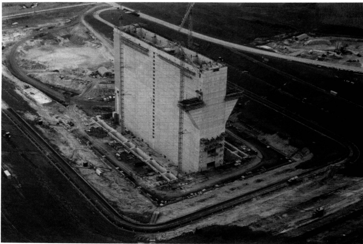
Vue du chantier, avril 1987