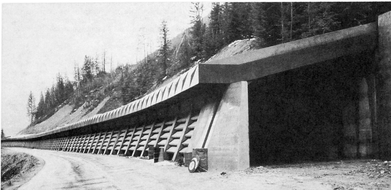
Vue de l'ouvrage paravalanche