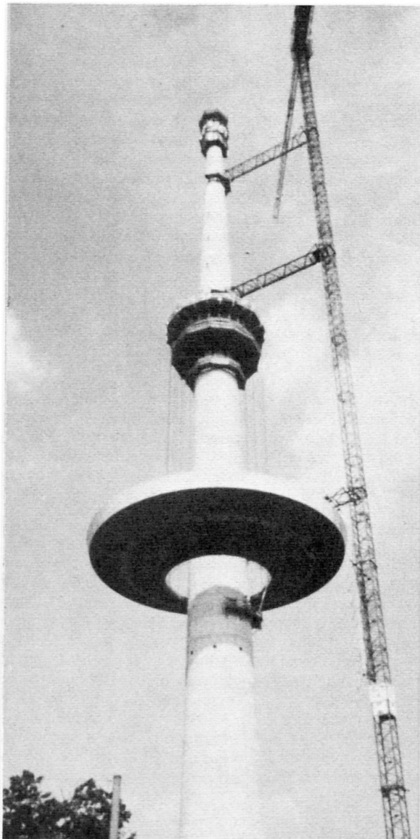
Bild 2 Hochziehen der 1200 Tonnen schweren Kegelschale