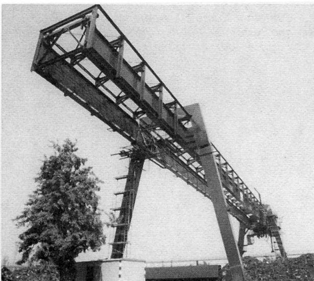
Bild 1 Gesamtansicht der Brücke

Die hydraulischen Antriebe, die bisher vornehmlich bei kleineren Anlagen zum Einsatz kamen, haben den Vorteil einer kontinuierlichen stufenlosen Regelung von Drehzahl und Moment, sowie eines äusserst niedrigen Leistungsgewichtes. Nachteile, wie die Gefahren von Leckagen und damit Brandgefahr, hoher Instandhaltungsaufwand zur Sicherstellung der Verfügbarkeit, sowie Probleme des Synchronlaufes mehrerer Antriebe sind beim Einsatz zu beachten, jedoch nicht immer gleichermassen relevant. Die einschlägige Industrie bietet heute hydraulische Aggregate und Elemente an, die eine hohe Betriebssicherheit gewährleisten, wobei Systemdrücke bis zu 250 bar zur Anwendung kommen. Von der erforderlichen Leistung bestehen heute kaum mehr Beschränkungen.