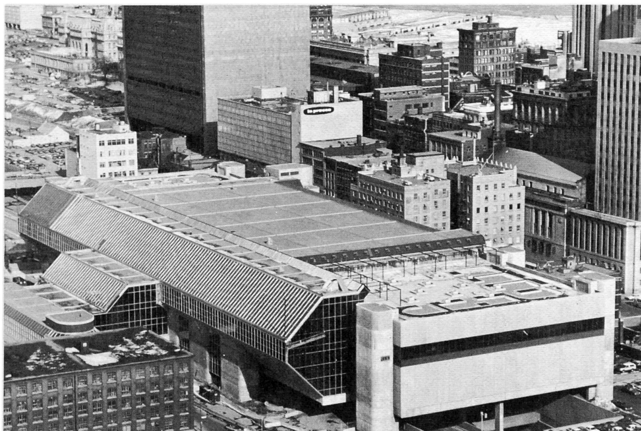
Fig. 2 Le Palais des Congrès de Montréal