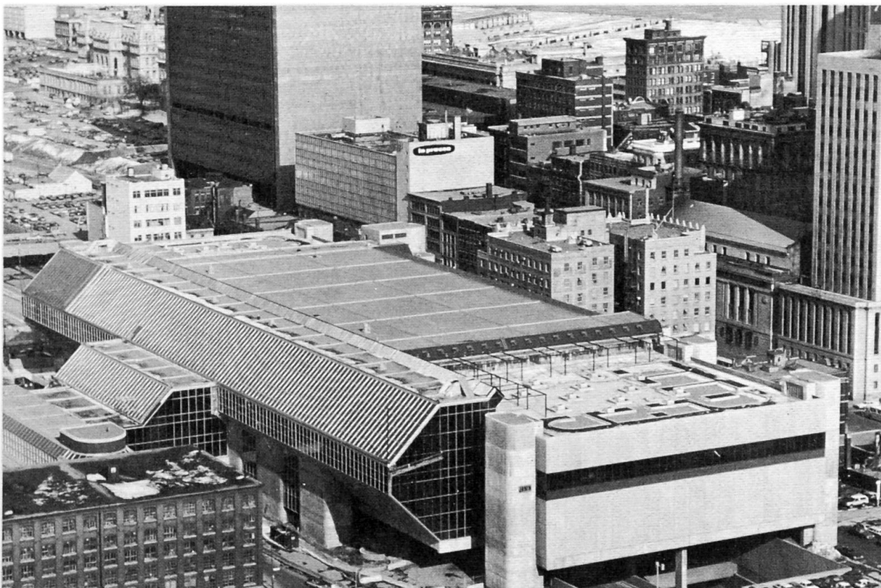
Fig. 2 Le Palais des Congrès de Montréal