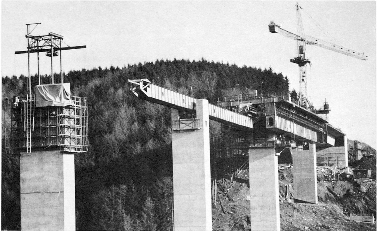
Bild 2 „Rechenschieber“; im Vordergrund selbstkletternde Pfeilerschalung