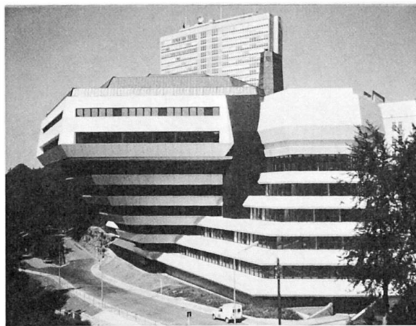
Fig. 4 Hémicycle parachevé