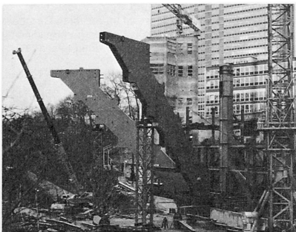
Fig. 2 Montage début mars 1979 des deux colonnes-caisson (29,8×3,5×0,9 m) dans l'encorbellement central

L'analyse structurale sur ordinateur par l'intermédiaire du programme aux éléments finis SAPLI5 provenant de l'Université de Liège, montra la nécessité de choisir un tel système porteur-cléf. C'est ainsi que sous l'effet des charges permanentes, la déformation à la pointe du porte-à-faux de 24 m ne devait être que de 20 à 30 mm. Ceci a été confirmé par les mesures réalisées sur place depuis le montage de la charpente métallique jusqu'à récemment.