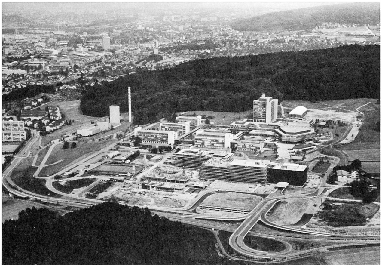
Flugaufnahme, Bauzustand Sommer 1974

Die Vertikallasten der 3 Untergeschosse und maximal 4 Obergeschosse werden durch Flachdecken aus Ortbeton und Stahlstützen mit einem Raster von 9,62 x 9,62 m abgetragen. Das Bauwerk mit maximal 9'500 m 2 Grundrissfläche ist durch Dilatationsfugen in 7 Trakte aufgeteilt. Diese Dilatationsfugen sind in den 1/5 Punkten der Decken-Spannweiten angeordnet. Die Horizontallasten werden in den einzelnen Teilen durch