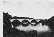
Eine der zahlreichen schönen Steinbogenbrücken Telfords 1809 erbaut, führt in Dunkel (Perth) über den Tay.

Telfords Schichten erstreckte sich auf handliche, damals zur Achtung kommenden Bauweisen. Die 1792 erbaute Brücke mit dem hohen kreisförmigen Bogen über den narrow Sea Sound ermöglichte die Durchfahrt der Schiffe. Da die Wasser des Atlantik bis in diesen Arm des Firth of Lorne gelangen trägt sie auch den Namen Atlantic bridge.