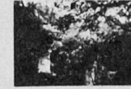
Ruine der High bridge über den Spean

Der schottische General Georg Wade (1673-1748) baute in den Jahren von 1726 bis 1740 mehr als 250 Meilen Strassen und ca. 40 Brücken. Die kühnste davon die 1736 errichtete High bridge führte mit 3 Bögen 100 Fuss hoch über die Schlucht des Spean, unweit des Dries Spean bridge, wo Telford 1809 eine Steinbogenbrücke schuf. Die verfallene High bridge wild verwachsen und schwer zugänglich, war sichtlich eine gewisse Zeit durch einen aufgesetzten Stahlträger begehbar gehalten worden.