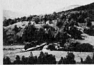
Suggan bridge über den Duthain

1778 durch General Wade ca. 2 Meilen westlich von Gairbridge, an der ursprünglichen Strasse von Kirkcubbin nach Inverness, errichtet. steht heute völlig einsam im Grünen.