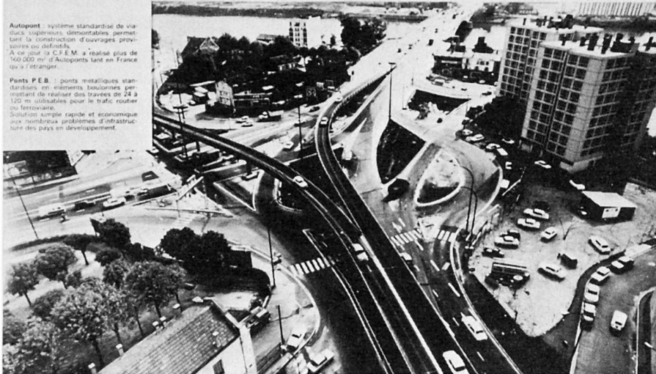
Autopont de Bezons

Autopont : système standardisé de viaducs superposés, démontables, permettant la construction d'ouvrages provisoires ou définitifs. À ce jour la C.F.E.M. a réalisé plus de 150 000 m 2 d'Autoponts tant en France qu'à l'étranger. Ponts P.E.B. : ponts métalliques standardisés en éléments boulonnés permettant de réaliser des travées de 24 à 120 m adaptées pour le trafic routier ou ferroviaire. Solution simple, rapide et économique aux nombreux problèmes d'infrastructure des pays en développement.