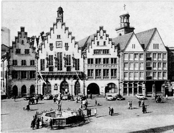
City Hall: Symbol of the City of Frankfurt

Frankfurt, Fed. Rep. of Germany May 12–14, 1986