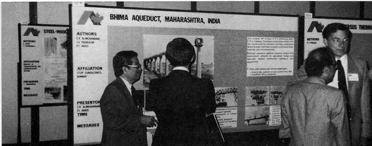
Poster Session: authors of a poster in discussion with other Congress participants