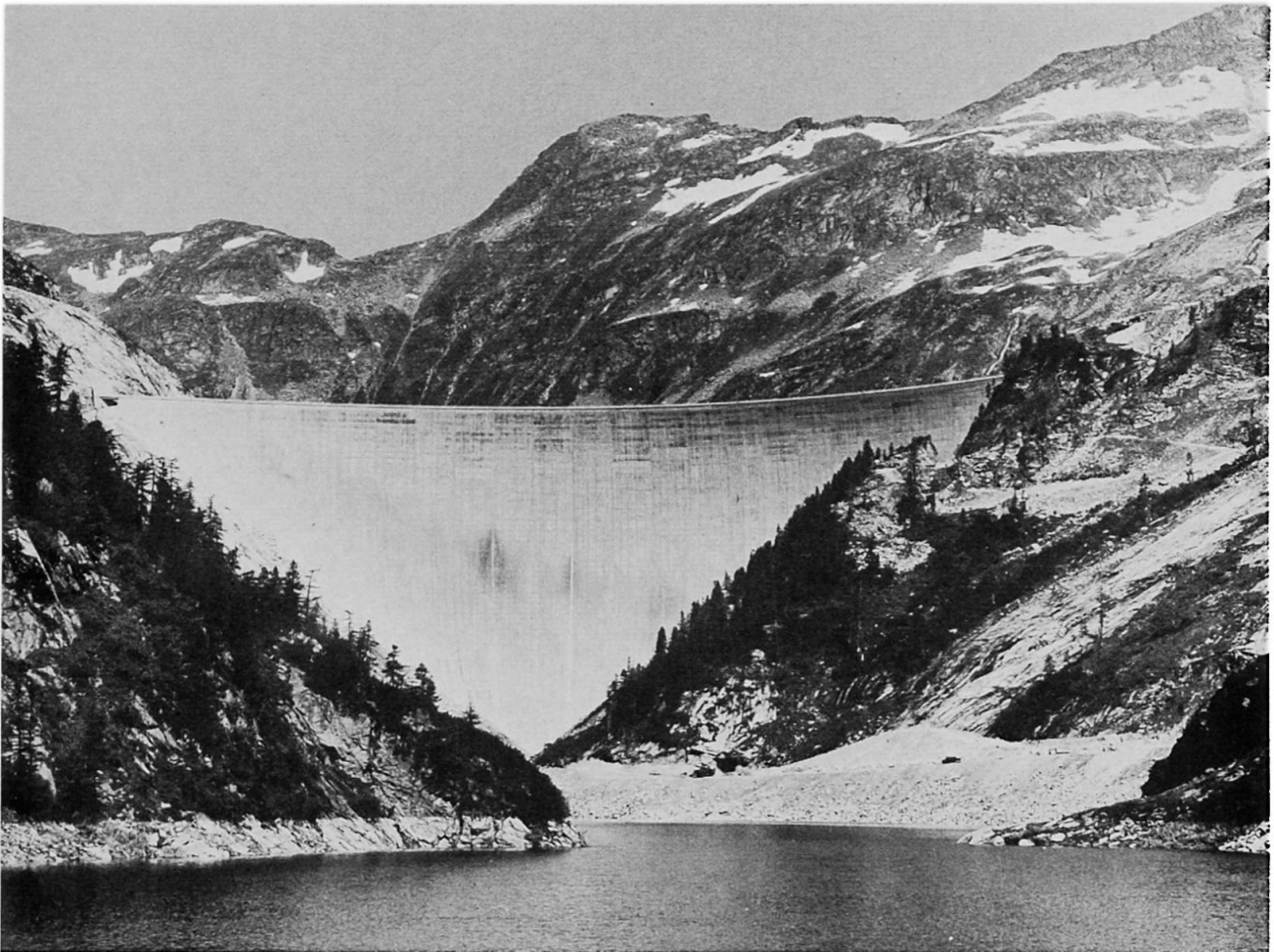
Bild 1. Kölnbreinsperre von der Luftseite, Stauziel 1.900 m ü.A.

Die Sperre Kölnbrein, eine Bogenstaumauer aus Beton, bildet den Jahresspeicher der Maltakraftwerke mit einem Stauziel von 1900 m ü.A. in Kärnten, Oesterreich. Sie wurde in den Jahren 1973 - 1977 gebaut und ist mit einer Höhe von 200 m, einer Kronenlänge von 600 m und einem Sperrenvolumen von 1,6 Mio m 3 die grösste Stau-mauer Oesterreichs. Mit einer maximalen Einbauleistung von 150.000 m 3 Beton im Monat verfügt die Baustelle über alle Merkmale einer Hochgebirgsbaustelle für Massenbeton und der Bauablauf war durch die Festlegung, die Betonierung in 3 Jahren durchzuführen, geprägt. In Anbetracht der klimatisch exponierten Lage der Baustelle waren für die Betonierung nur die Monate Mai bis Oktober disponierbar, das heisst, die Betonierung musste in 18 Monaten und mit Berücksichtigung von Schlechtwetter und sonstigen Störungen in ca. 400 Tagen erfolgen. Da sich 130 - 135 Einbautage je Saison mit den bisher auf Hochgebirgsbaustellen üblichen Arbeitszeitregelungen nicht erreichen lassen und eine Verringerung der Einbautage zu einer erheblichen Vergrösserung der Baustelleneinrichtung geführt hätte, musste eine besondere Disposition der Arbeitszeit entwickelt werden. Die gesetzliche Arbeitszeit war in den letzten zwei Jahrzehnten, seit in Oesterreich grosse Talsperren gebaut werden, schrittweise von 48 über 43 auf 40 Stunden verkürzt worden und dies war die eigentliche Wurzel des Problems.