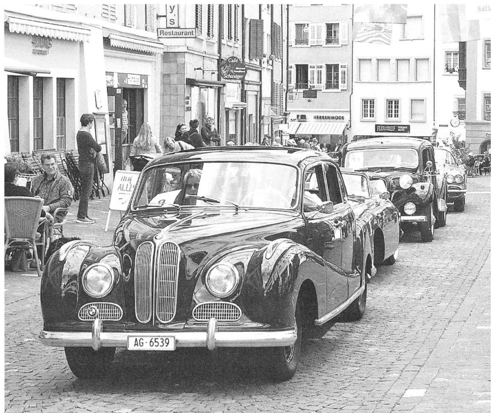
Grosses Festwochenende mit dem «Fescht im Wescht» vom 6. bis 8. September. Zur Erinnerung an 25 Jahre Umfahrung fährt ein Oldtimer-Korso durch die Altstadt.

■ 6. – 8. Grosses Fest-Wochenende in Bremgarten. Mit dem «Fescht im Wescht» feiern die Stadt Bremgarten 25 Jahre Umfahrung Bremgarten und Aargau Verkehr AG (AVA) die Einweihung des Bahnhofes Bremgarten West, den Abschluss der Streckensanierung zwischen Wohlen und Bremgarten sowie die Fertigstellung des neuen Dienstgebäudes in Bremgarten. Neben einem Oktoberfest, einer Rock Night und einem Country Day gibt es Bahn-Nostalgiefahrten von Bremgarten West nach Wohlen, einen Oldtimer-Korso durch die Altstadt bis ins West, einen Tag der