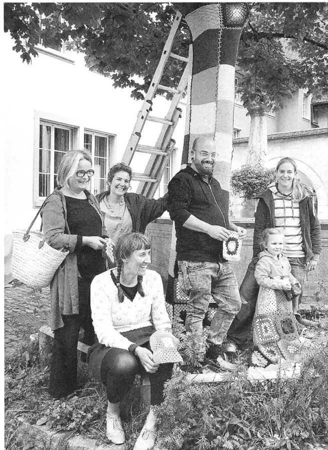
Auftakt zum ArtWalk der Vereinigung Bremgarter Altstadtgeschäfte VBA. Das Kubeïs-Team verkleidet den Baum beim Rathausbrunnen.