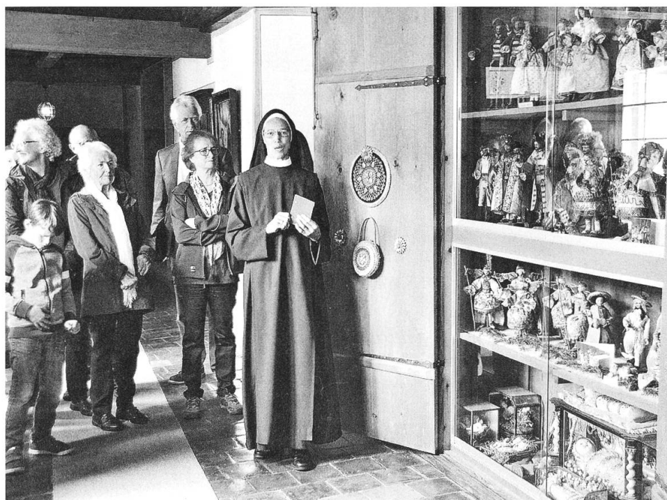
Der Bürgertag der Ortsbürgergemeinde Bremgarten führt die 150 Besucherinnen und Besucher hinter die Mauern des Klosters Hermetschwil.

shop haben die Projektverantwortlichen einen Konzeptvorschlag für die Zukunft des Standortmarketings und der Standortförderung erarbeitet. Er soll bis Ende der Sommerferien dem Stadtrat vorgelegt werden. ■ 28. An ihrer Generalversammlung beschliesst die Wandergruppe Bremgarten, sich per Ende Oktober 2019 aufzulösen.