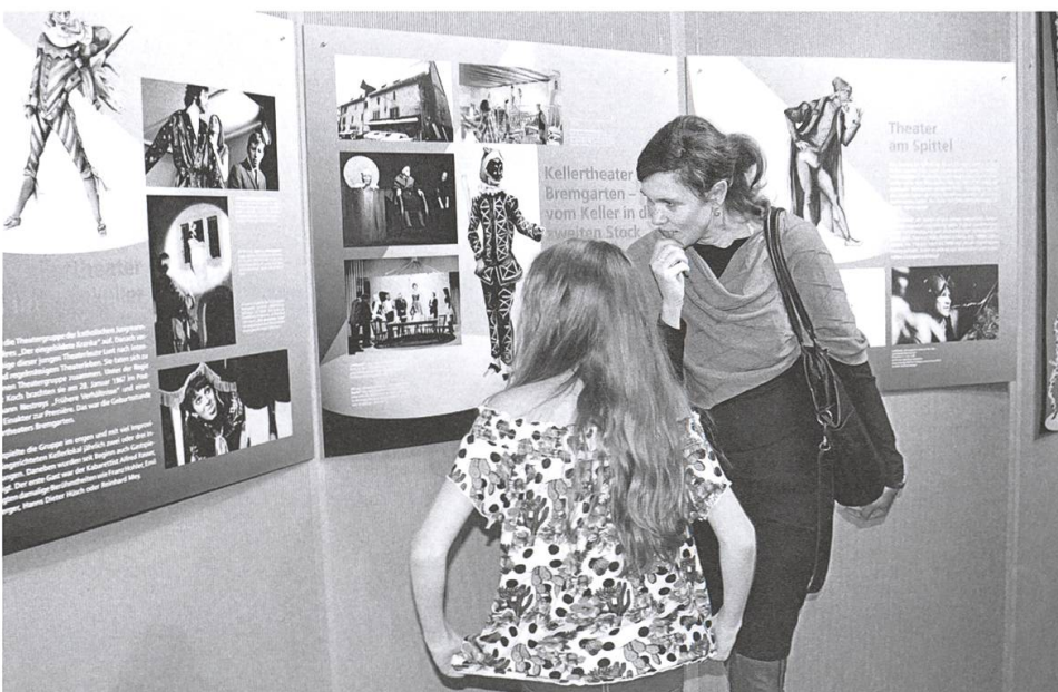
Im Stadtmuseum wird die Ausstellung zum reichen Theaterleben Bremgartens eröffnet.