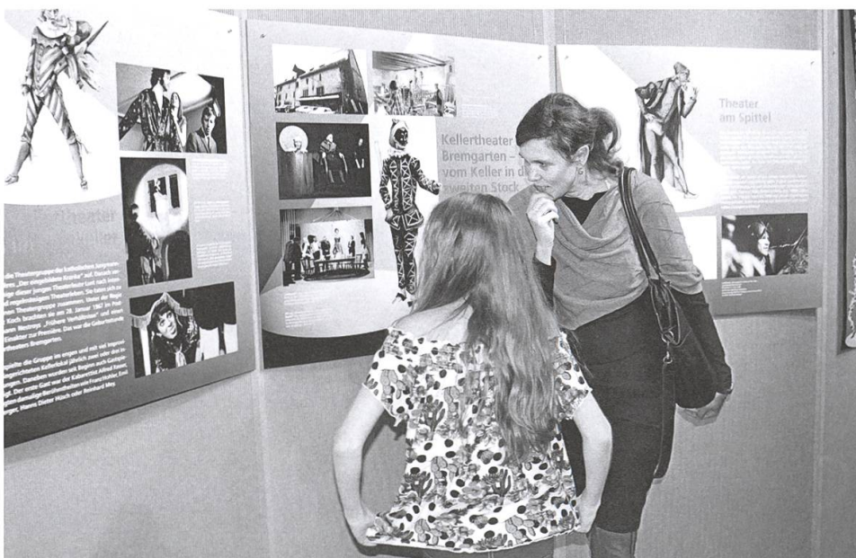
Im Stadtmuseum wird die Ausstellung zum reichen Theaterleben Bremgartens eröffnet.