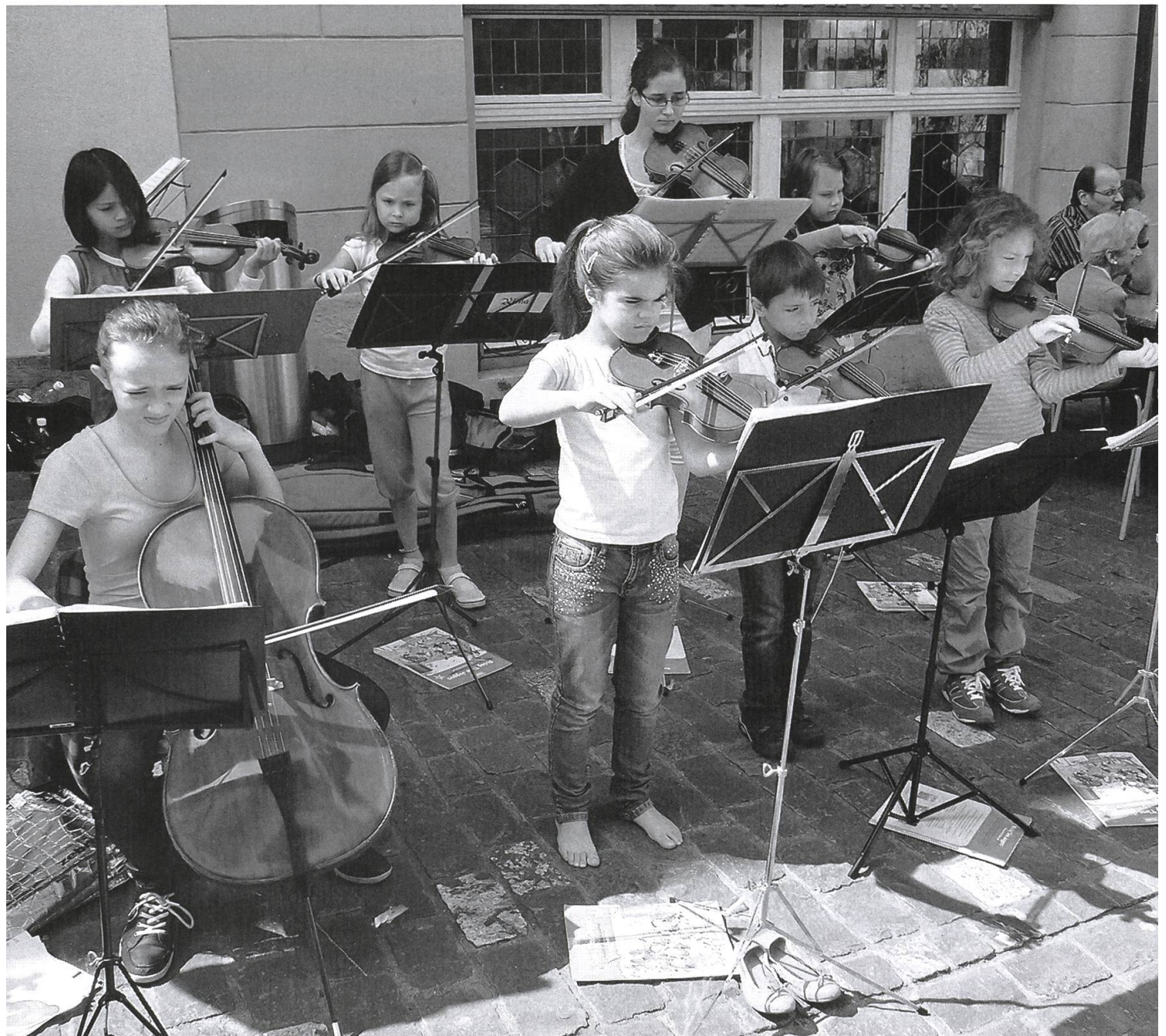
«Musig i de Gass» demonstriert die hervorragende Arbeit der Musikschule und verhilft auch kleinen Instrumentalisten zu einem Erfolgserlebnis.