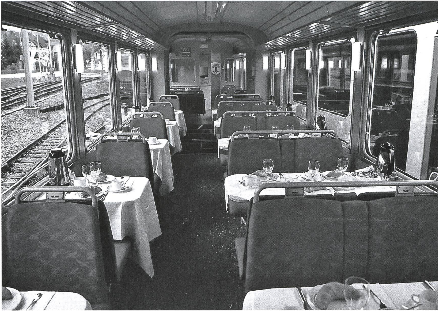
Innenansicht des Sebni.