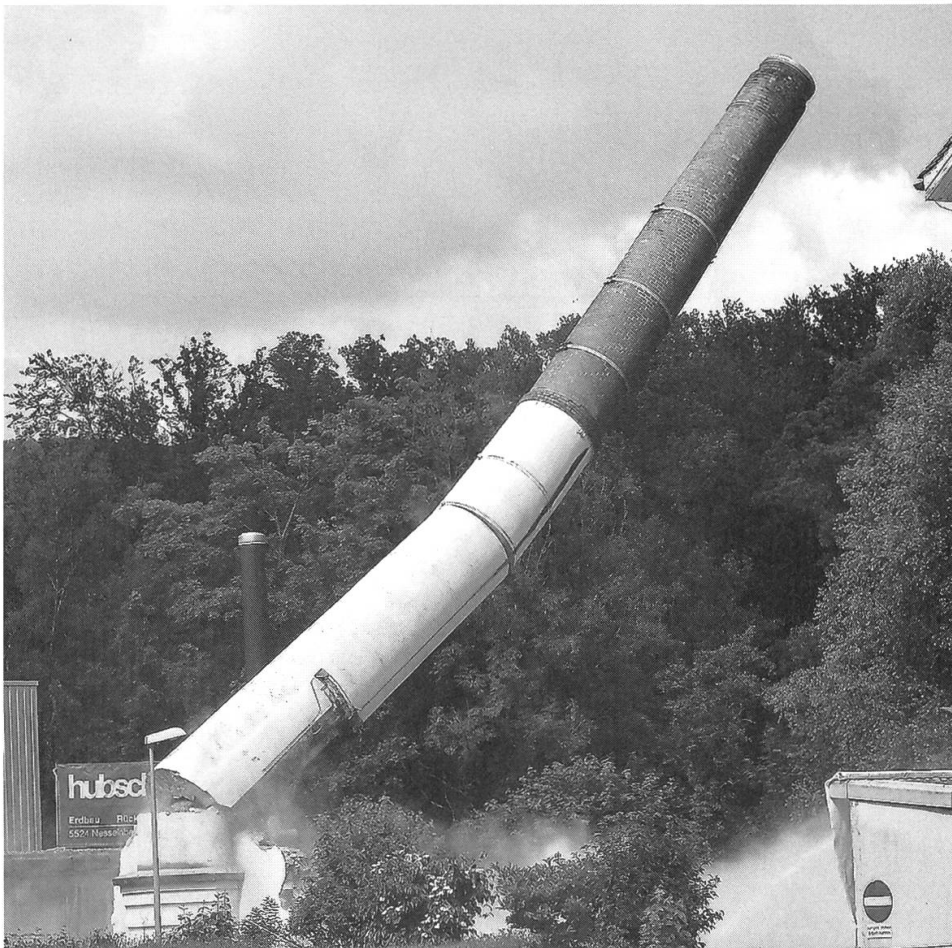
Ein Knall, der Kamin neigte sich und fiel genau in die vom Sprengteam vorge-sehene Richtung. Ein Schauspiel von wenigen Sekunden.