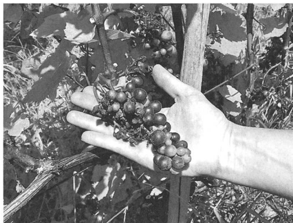
Folgen des Hagelgewitters vom Juli 2011. Die Ortsbürger müssen einen 90-prozentigen Ernteausschlag hinnehmen.