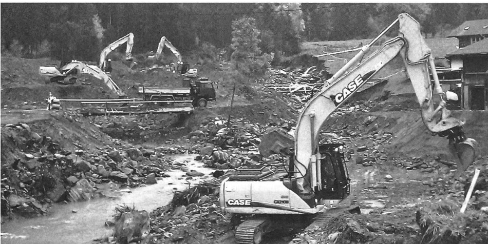
Baumaschineneinsatz im Kandertal 2011.

Die Kompanie wird in verschiedene Züge eingeteilt: Genie-, Rettungs-, Logistik-, Verkehr/Transport- und Kommando zug (Rückwärtiges/Übermittlung). Der Grossteil der Ausbildungen erfolgt in der bereits erwähnten 5 – 6-wöchigen Überlappungsphase. Im Anschluss folgen Übungen und Trainings in den einzelnen Zügen, in welchen das angeeignete Wissen vertieft wird. In der Ausbildung wird auch darauf geachtet, dass Retter in den Belangen der Genisten und umgekehrt geschult werden. Somit wird gewährleistet, dass der Auftrag jederzeit erfüllt werden kann. Im Anschluss erfolgen Volltruppenübungen, in denen das Zusammenspiel des ganzen Verbandes trainiert wird. Als Ergänzung und besonders wertvoll sind Übungen in Zusammenarbeit mit den zivilen Einsatzpartnern. Diese ermöglichen das gegenseitige Kennenlernen und fördern das beidseitige Verständnis.