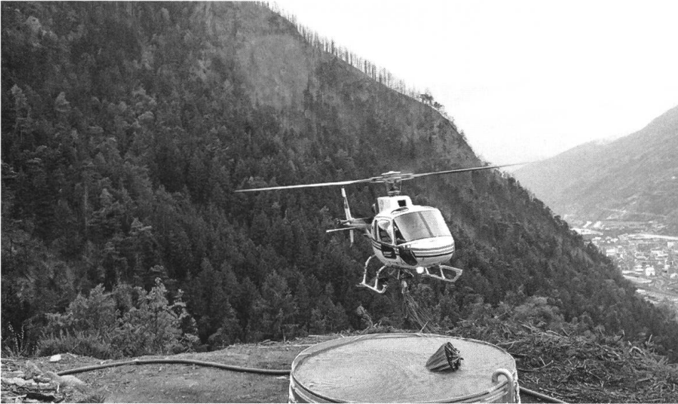
Ausgleichsbecken als Wasserbezugsort für Löschhelikopter Waldrand Visp.