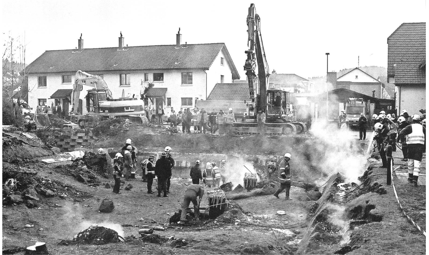
Einsatz Feuerwehrglück Gretzenbach im Jahr 2004.