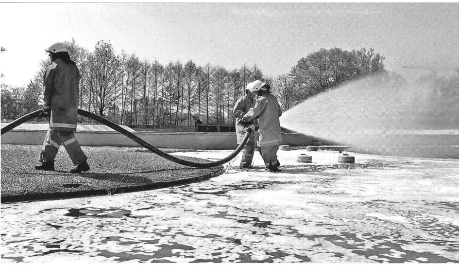
Ausbildung von Löschmitteln (Einsatz Schaummittel).