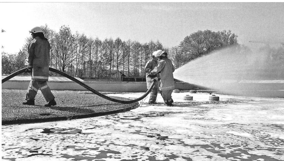
Ausbildung von Löschmitteln (Einsatz Schaummittel).