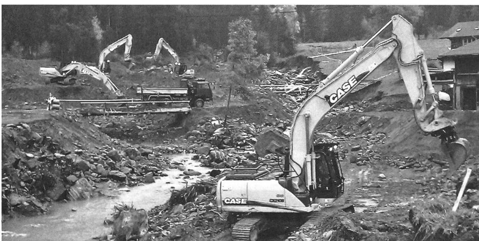
Baumaschineneinsatz im Kandertal 2011.

Die Kompanie wird in verschiedene Züge eingeteilt: Genie-, Rettungs-, Logistik-, Verkehr/Transport- und Kommandozug (Rückwärtiges/Übermittlung). Der Grossteil der Ausbildungen erfolgt in der bereits erwähnten 5 – 6-wöchigen Überlappungsphase. Im Anschluss folgen Übungen und Trainings in den einzelnen Zügen, in welchen das angeeignete Wissen vertieft wird. In der Ausbildung wird auch darauf geachtet, dass Retter in den Belangen der Genisten und umgekehrt geschult werden. Somit wird gewährleistet, dass der Auftrag jederzeit erfüllt werden kann. Im Anschluss erfolgen Volltruppenübungen, in denen das Zusammenspiel des ganzen Verbandes trainiert wird. Als Ergänzung und besonders wertvoll sind Übungen in Zusammenarbeit mit den zivilen Einsatzpartnern. Diese ermöglichen das gegenseitige Kennenlernen und fördern das beidseitige Verständnis.