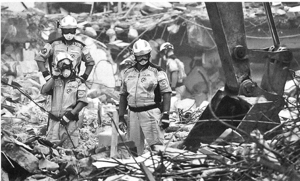
Erdbebeneinsatz Indonesien/Sumatra im Jahr 2008.