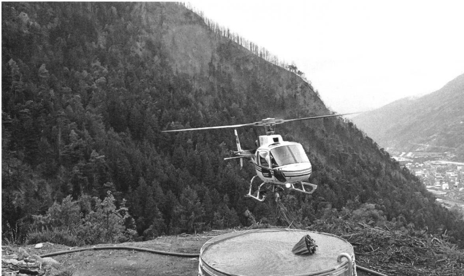
Ausgleichsbecken als Wasserbezugsort für Löschhelikopter Waldrand Visp.