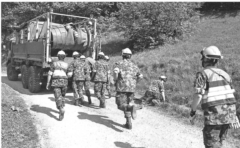
Wassertransport Einsatz Waldbrand Visp.