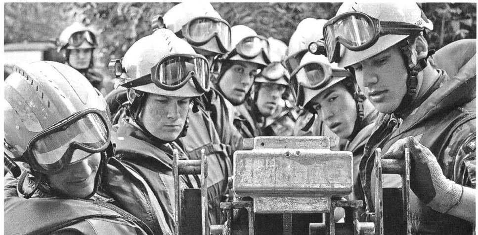
Genisten beim Brückenbau.