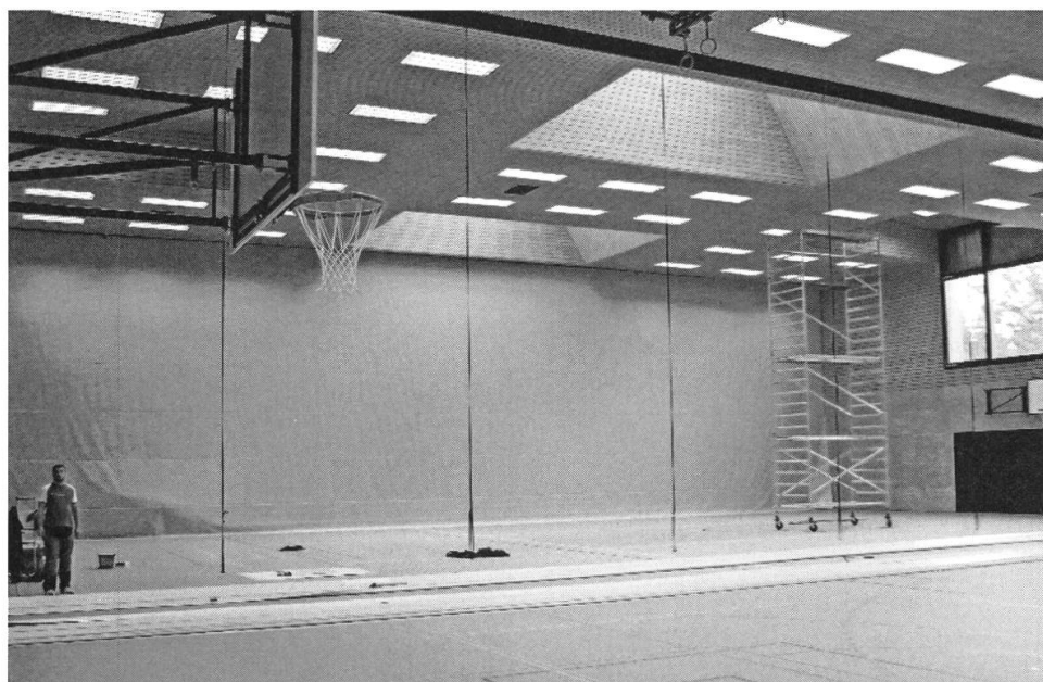
Die Montage des Trennvorhanges

Der Bau weist verschiedene spezielle Eigenheiten auf. Um Energie zu sparen, wurde er im Minergiestandard (mit Label) realisiert. Die Heizung und Warmwasseraufbereitung erfolgt über den von der AEW Energie AG erstellten neuen Wärmeverbund primär mit Holzschnitzeln. Die Lüftungsanlage ist mit einer Wärmerückgewinnung versehen. Bei der Dachkonstruktion ist ein spezieller Aufbau gewählt worden, der viel leichter ist als der von der Totalunternehmung ursprünglich vorgesehene. Dies ermöglicht eine künftige Montage einer Solar-/Photovoltaikanlage. Dazu sind auch bereits verschiedene Vorinvestitionen getätigt worden. Um in der Halle eine möglichst gute Akustik zu erreichen, sind eine vollflächige Akustikdecke und an den Wänden Akustikelemente montiert. Die Halle ist mittels grossen Fenstern und Oblichtern gut mit natürlichem Licht durchflutet. Für Wettkampfsportarten mit hohem Lichtbedarf (z.B. Tischtennis) ist in der Halle eine zuschaltbare Zusatzbeleuchtung installiert. Der Hallenboden ist als punkt- bzw. mischelastischer Boden konzipiert, damit dieser für alle Schulstufen sowie für die Vereinssportarten sehr gut geeignet ist. Grosser Wert wurde auf eine ökologische Bauweise gelegt. Als unterhaltsarme Fassade wurde eine Eternitverkleidung gewählt.