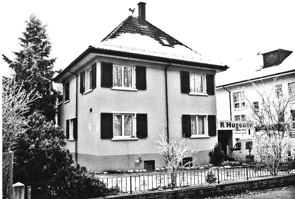
Kirchenlokal an der Kreuzmattstrasse.

Eifer für die wachsende Gemeinde an der Kreuzmattstrasse 4 ein. Dabei wurde er unterstützt von seinem Freund und ortsansässigen Priester Oswald Briner.