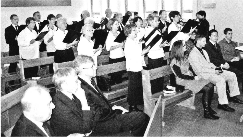
Festgottesdienst 14. Dezember 2008 Darbietung des Gemeindechors.