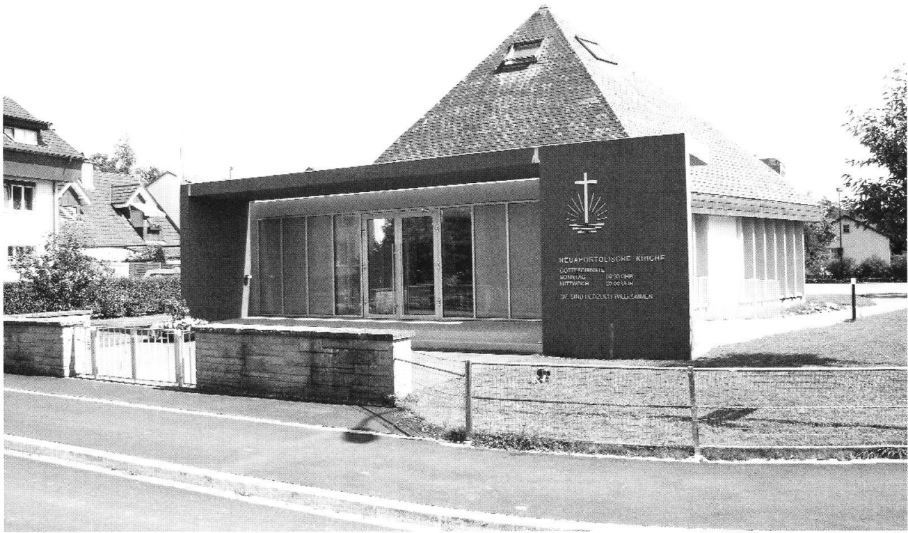
2008 Die Kirche nach dem Anbau wie sie sich heute präsentiert.

Im Jahre 2002 erfolgte an der Kirche ein Anbau. Deshalb fand die Gemeinde für ein halbes Jahr Unterkunft im «Haus zur Reuss» in der Unterstadt. Die Ortsbürgergemeinde Bremgarten hatte dies sehr wohlwollend unterstützt.