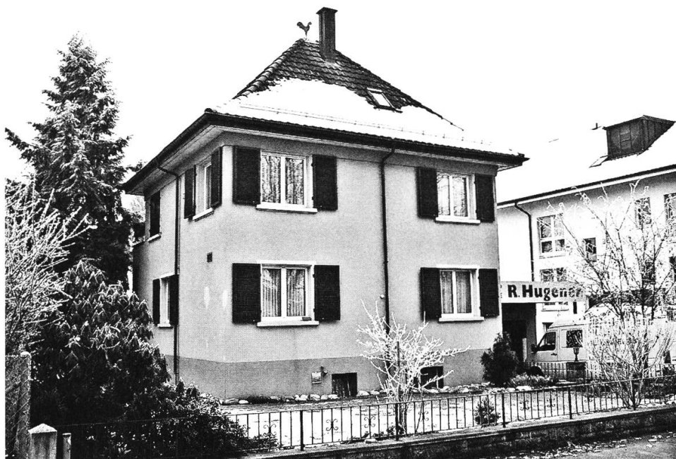
Kirchenlokal an der Kreuzmattstrasse.

Eifer für die wachsende Gemeinde an der Kreuzmattstrasse 4 ein. Dabei wurde er unterstützt von seinem Freund und ortsansässigen Priester Oswald Briner.