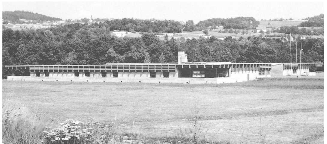
Das Truppenlager (Camp) 1964, im Jahre seiner Inbetriebnahme.