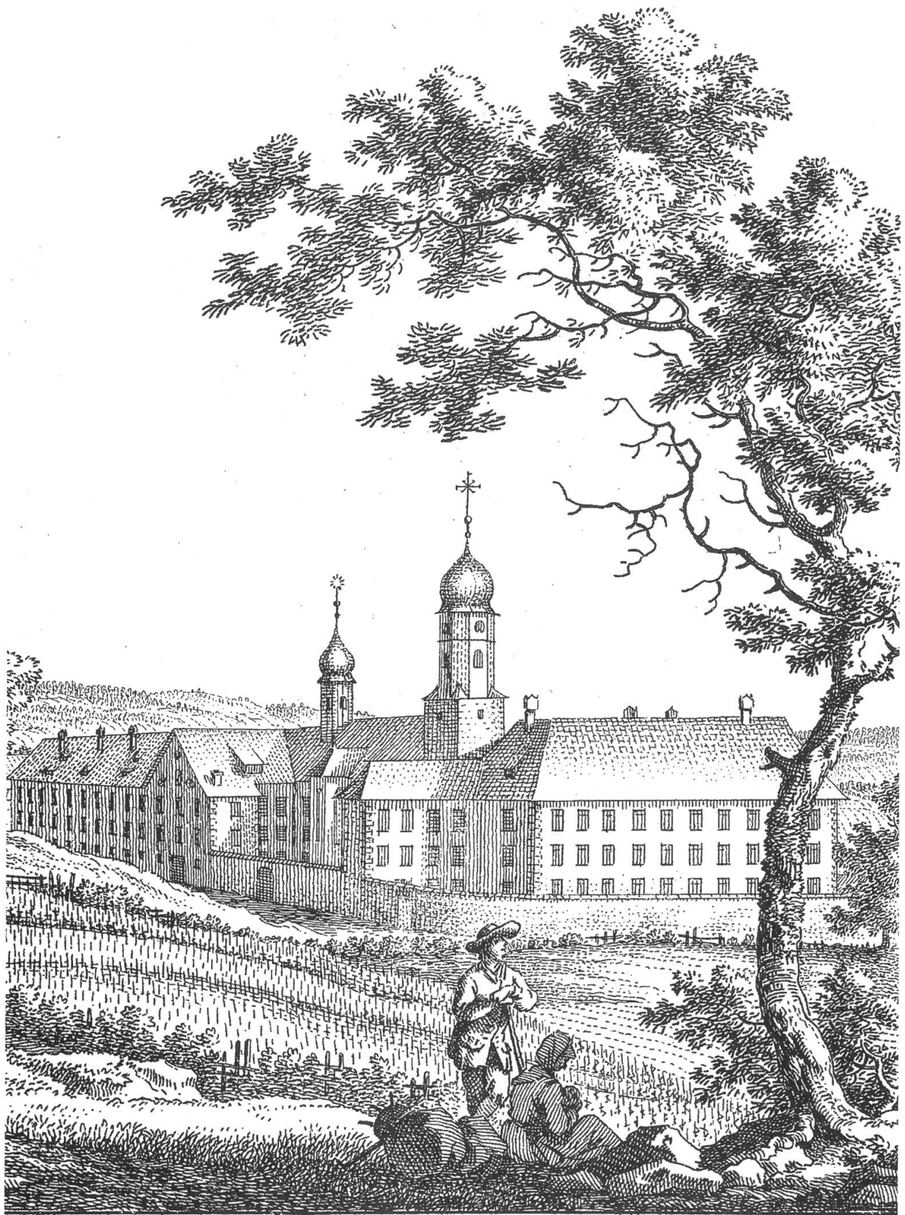
Das Kloster Fahr, von Mitternacht anzusehen.