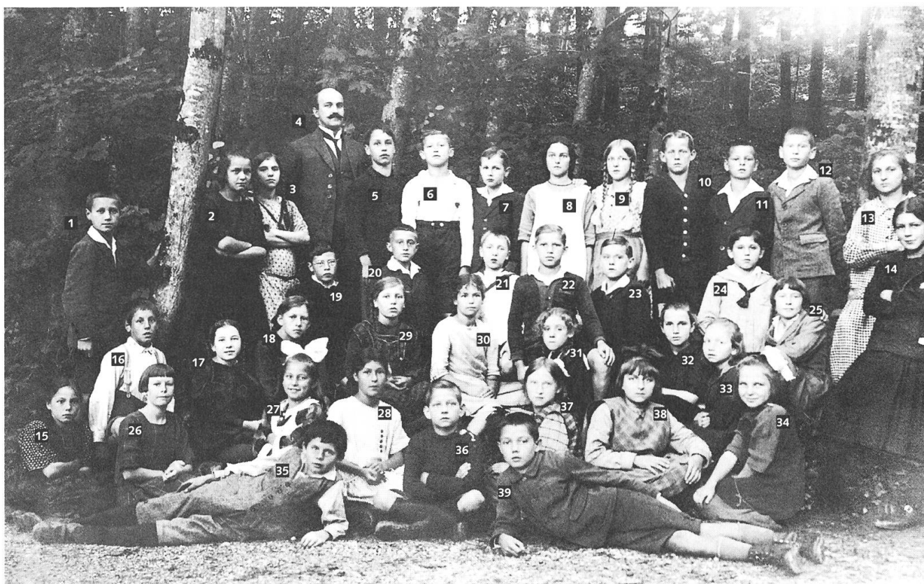
Jahrgang 1914 (und Nov./Dez. 1913): Gemeindeschule, 5. Klasse