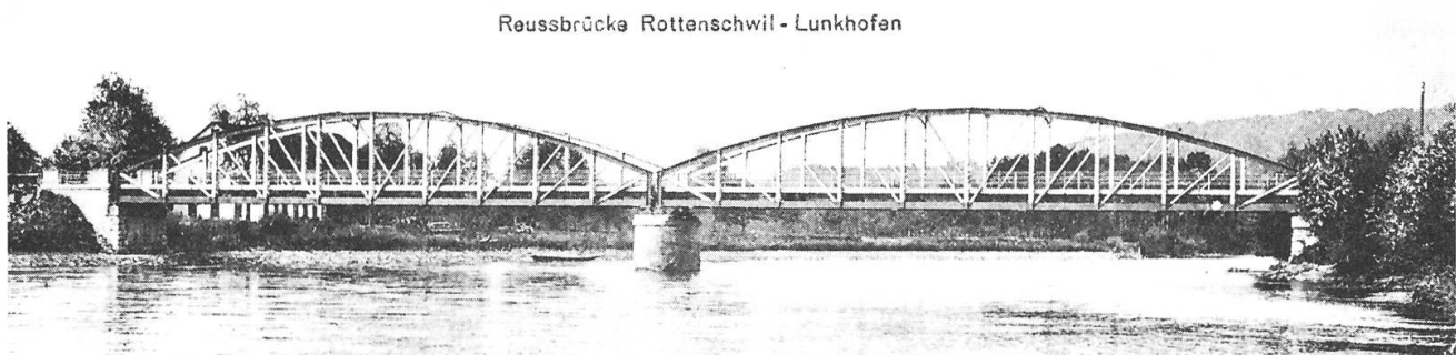
Reussbrücke Rottenschwil - Lunkhofen

oben: Gasthaus «zum Hecht», in Rottenschwil; rechts im Hintergrund das (heute abgerissene) ehemalige Fährhaus.