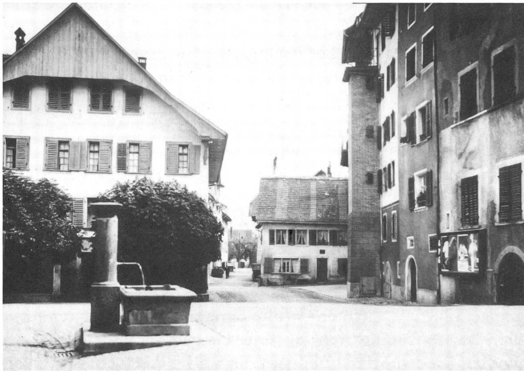
Am Kreuzplatz mit Blick in die Schenkasse. Links im Bild der ehemalige Gasthof zum Kreuz. Hier standen 1831 die vier Baselbieter Revolutionäre unter Hausarrest.

nern auch von einigen ihrer Freunde aus dem Freienamt über die Gasse gesprochen worden, die Graubündtner Wache habe sich aber bald in das Zimmer der Beaufsichtigten begeben, diese aus den Fenstern gewiesen und sich selber ganz breit darein gelegt.» 13)