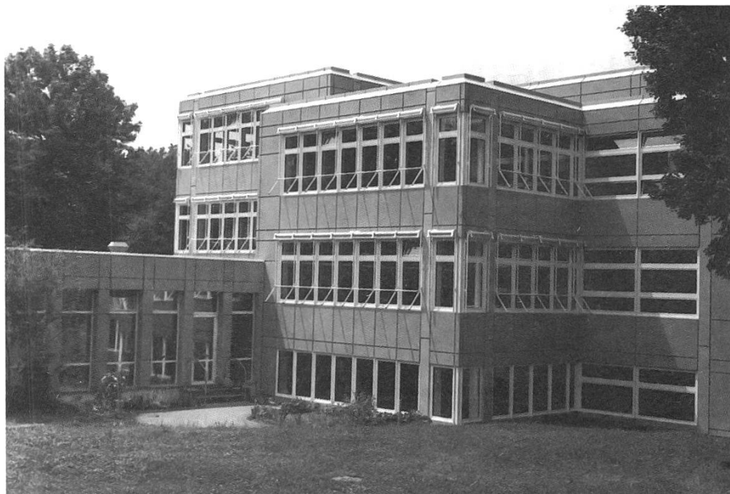
Promenadenschulhaus: Blick auf die Schulräume von Osten

Zur Sonnensteuerung gehört die Beschattung. Diese ist hier reduziert auf die Beschattung der Fensterpartien und dient im wesentlichen als Blendschutz und Belichtungsregulator bei gleissendem Aussenlicht. Der Sonnen- und Blendschutz ist voll von der Fassade abgesetzt, so dass die aufsteigende Warmluft