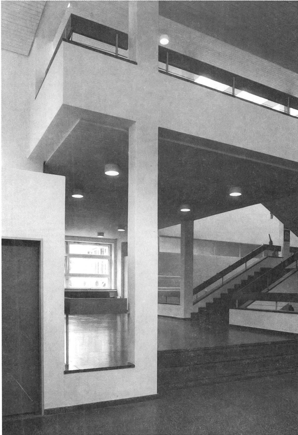
Promenadenschulhaus: Einblick in die Halle