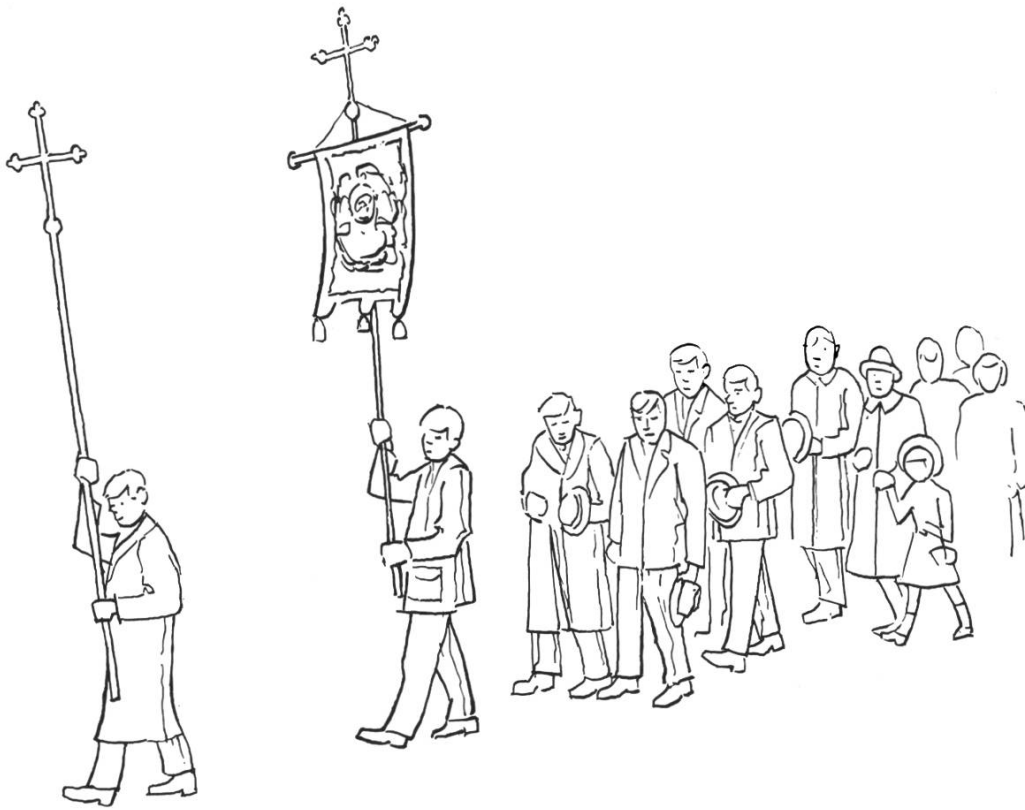
Bittgang mit Kreuz und Fahne