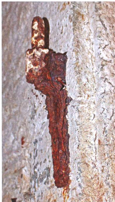
Verrostete Türangeln zeugen von einstigen massiven Toren, auch zwischen den beiden Kellern.