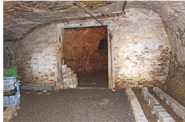
Blick in den kleineren, zweiteiligen Felsenkeller

ein Begriff. Er lag in der Nähe des Schildkrötenweihers und des Weihers mit den Schleien an der Aare. Während der Aarekorrektur waren neben dem Fluss quer zum Tal liegende Dämme errichtet worden. Dazwischen befanden sich diese Weihern. Die meisten dieser Stillgewässer wurden vor 1952 mit dem Aushubmaterial des Unterwasserkanals für das Kraftwerk Villnachern aufgefüllt. Der Klare Weiher wurde in der Folge als Grube für die Schutt-ablagerung genutzt.