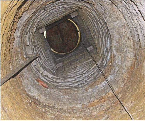
Der Belüftungsschacht führt senkrecht nach oben.