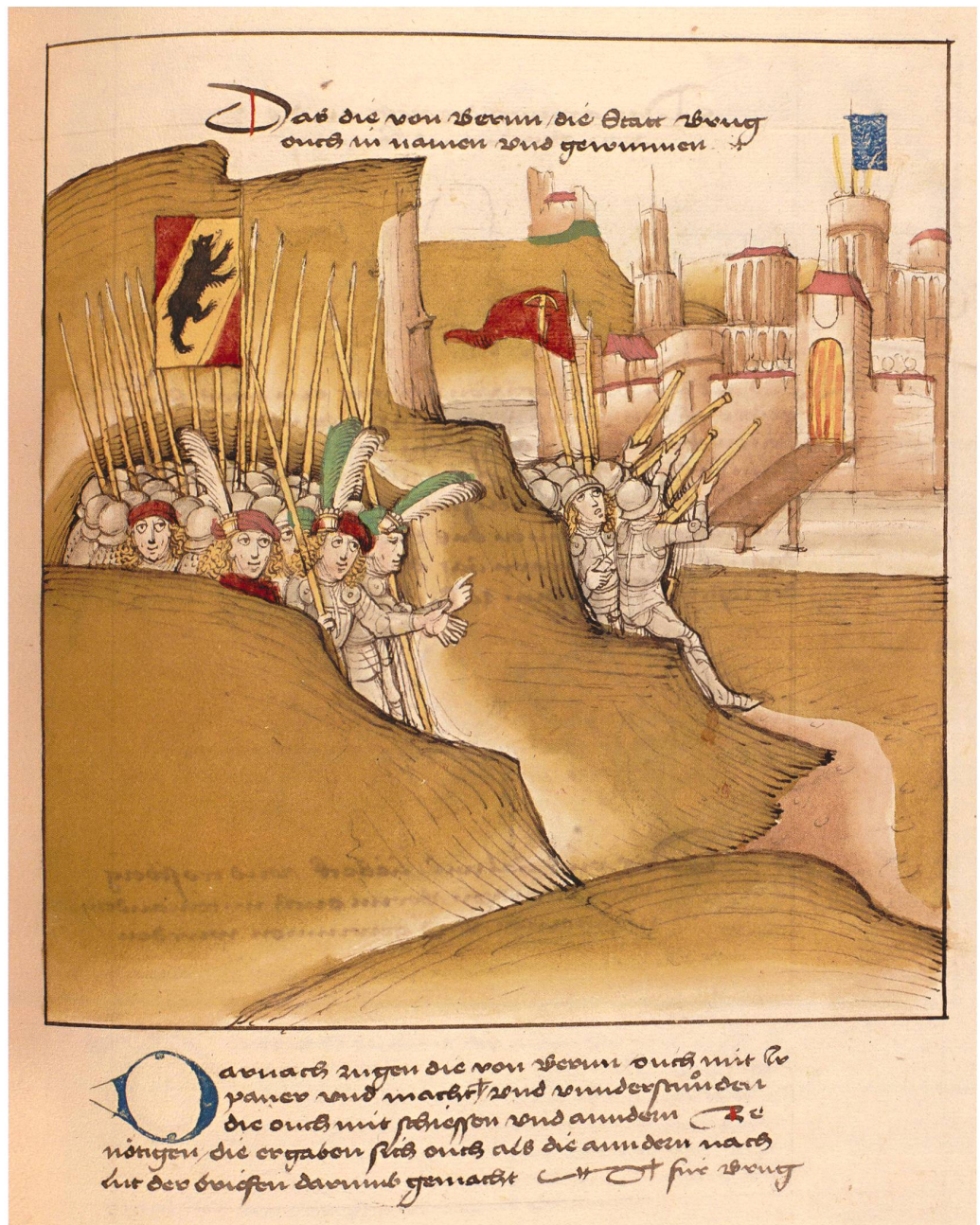
Einnahme von Brugg. Darstellung in der Spiezer Chronik von Diebold Schilling, 1484/85