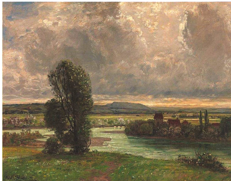
Landschaft mit Aare und Reuss, 1896. 60 × 90 cm, Öl auf Leinwand; Stiftung für Kunst, Kultur und Geschichte, Winterthur.

det ist und von mir ein Bild wünscht, vielleicht ein Flussbild malen? Ein offenes mit aargauer Charakter, weisst, wo Reuss und Aare mit Limath nach Waldshut fahren. Eine Art Seldwyla.» (Brief an Schwester Adèle, 10. April 1896)