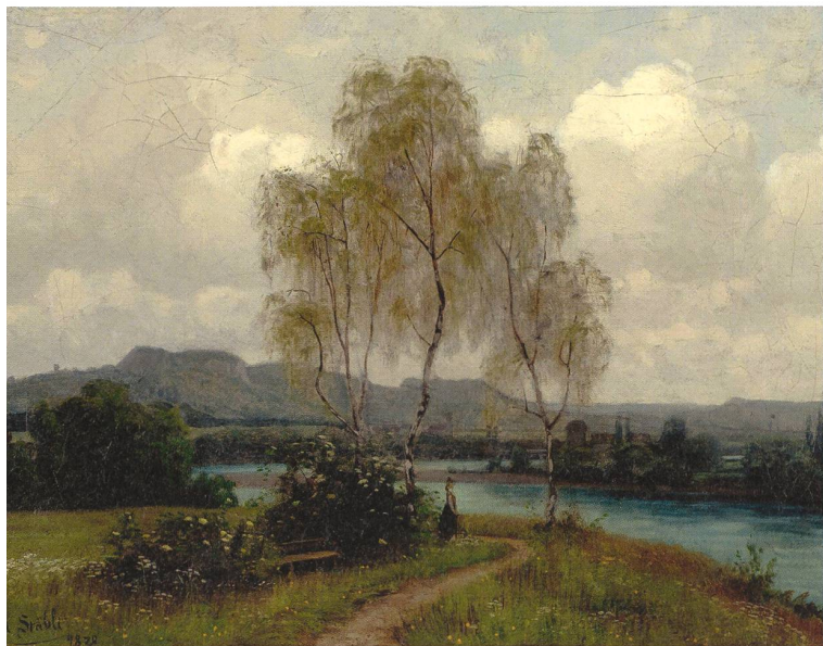
Landschaft am Wasser, 1878. 33,5 × 46,5 cm, Öl auf Leinwand.