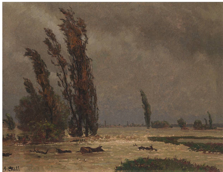
Überschwemmtes Land, 1888. 48 × 56,5 cm, Öl auf Leinwand, Privatbesitz.