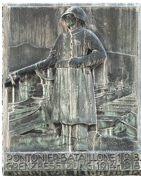
Gedenktafel für die Pontonier-Bataillone 1, 2 und 3 an der Westwand des Bezirksgerichtsgebäudes Brugg

Am 7. August besprachen die Gemeindevertreter des Bezirks unter anderem Fragen der Lebensmittelversorgung, der Armenunterstützung, der Feuerwehr sowie die Besetzung von Vakanzen in